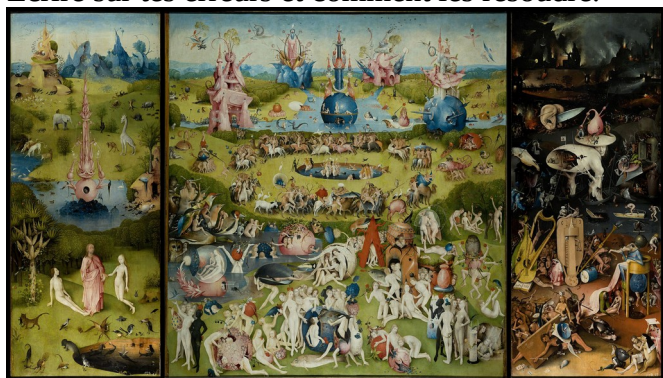
Hieronymus Bosch - Le Jardin des Délices Terrestres

Écrire sur tes erreurs et comment les résoudre.